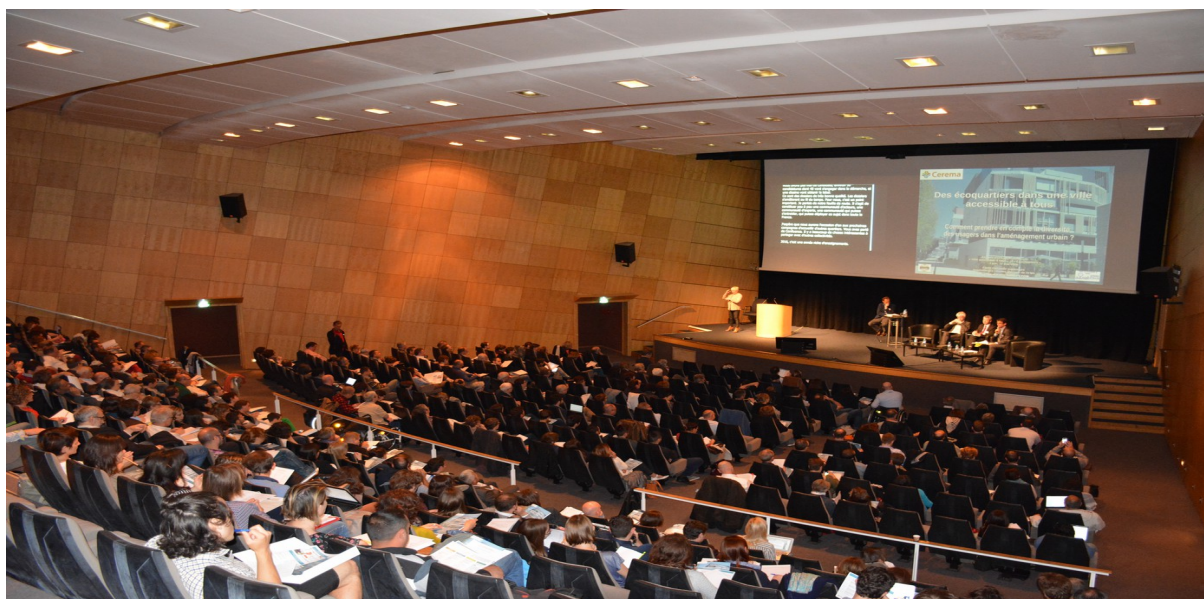
Plus de 370 personnes représentant les collectivités, la maîtrise d'œuvre, les services de l'État et les associations d'usagers ont participé à l'événement