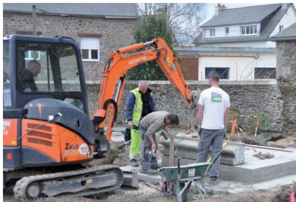
Reconstruction du monument aux morts

L'ingéniosité des hommes, le ballet des engins et la force des matériels au service d'un chantier qui va durer vingt mois.