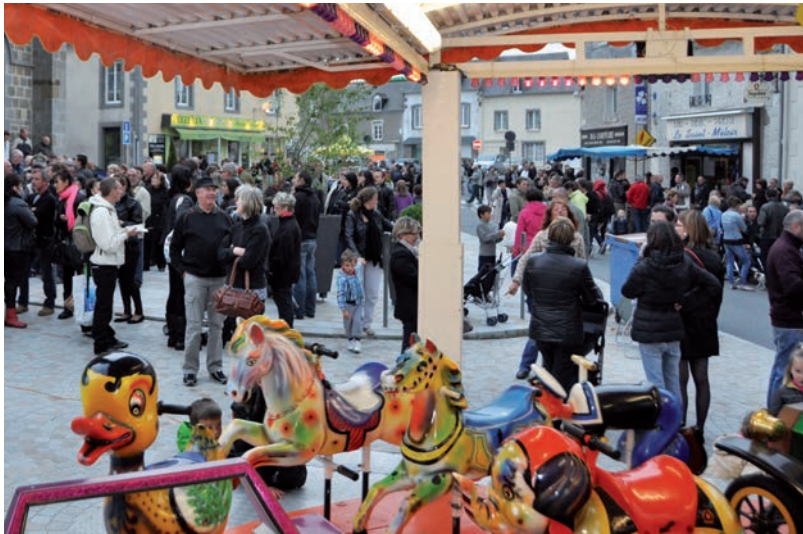
Fête de la Musique 2013

Un embellissement pour une plus grande attractivité commerciale et le plaisir de goûter à la convivialité