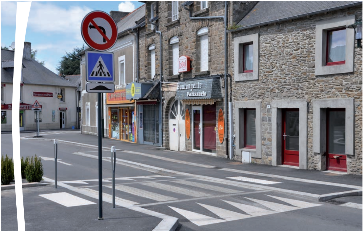
Les seuils des commerces rendus accessibles