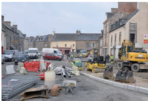
Le grand chantier