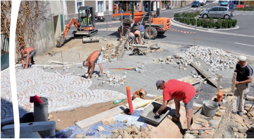
Pavage du parvis de la Mairie