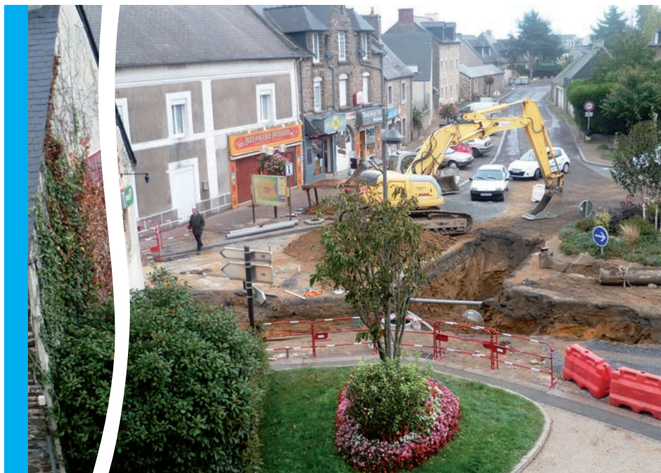
Effacement des réseaux