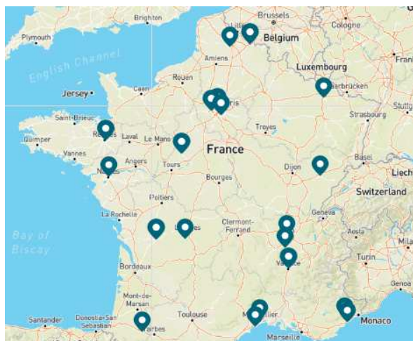
Carte de France des signataires

Le Cerema et Logistic Low Carbon accompagnent également la collectivité sur la concertation avec les acteurs économiques à travers la cartographie des acteurs locaux, des rendez-vous bilatéraux avec ces derniers, l'organisation de séminaires d'information et de groupes de travail, entre autres.