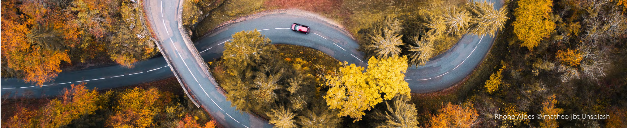
Rhône Alpes