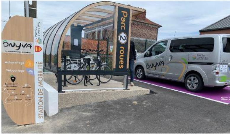
7 Stations de mobilité inaugurées le 03/05/22

« C'est un service réconfortant qui crée du lien social »