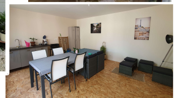
Un lieu de partage et d'animations au sein de l'opération Source Cerema du Sud Ouest