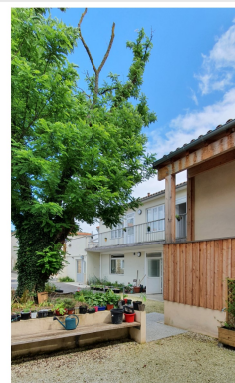
Après l'opération Source Soliha Gironde – CEREMA sud Ouest

Source Soliha Gironde – CEREMA sud Ouest