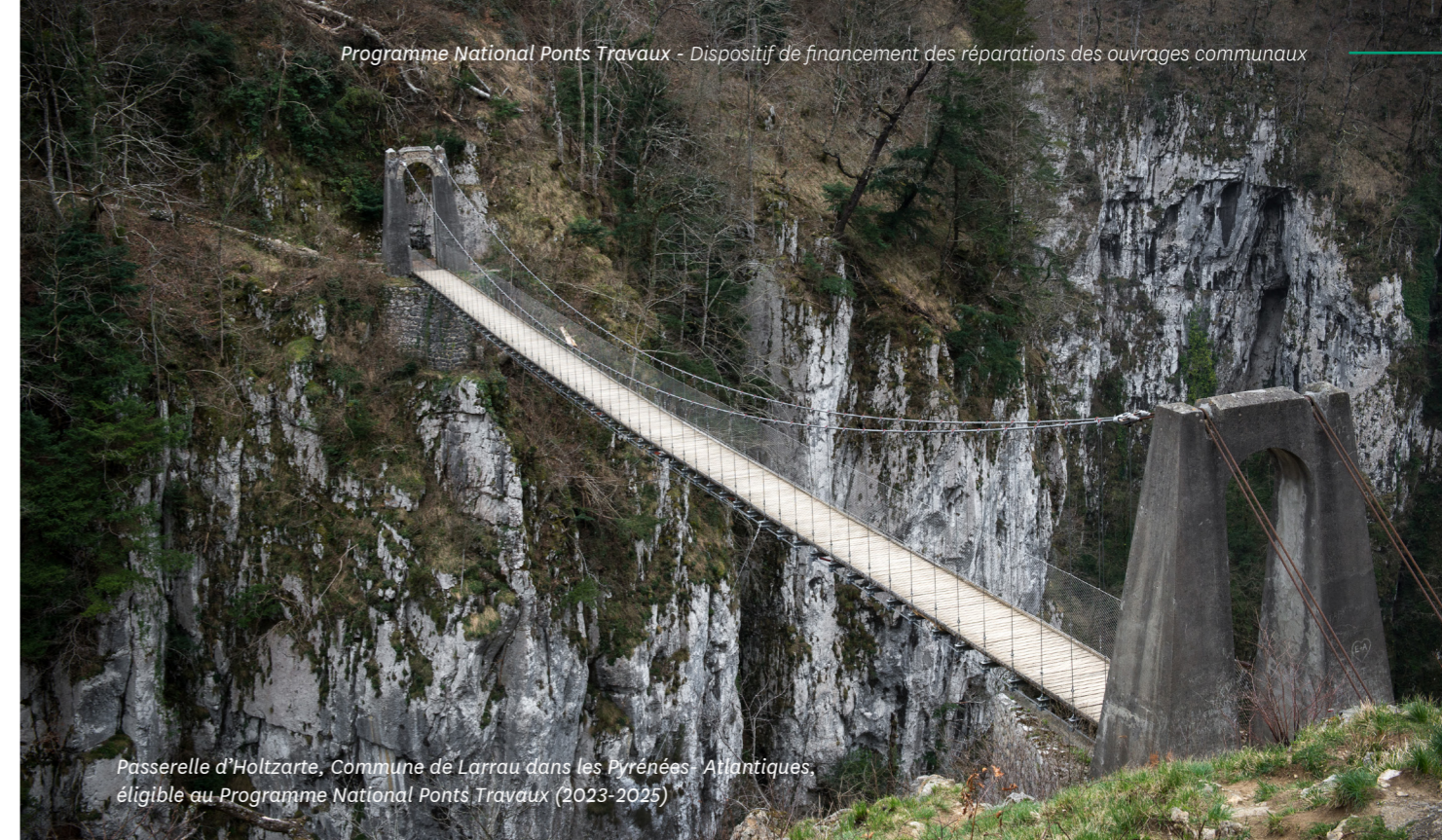
Passerelle d'Holtzarte, Commune de Larrau dans les Pyrénées Atlantiques, éligible au Programme National Ponts Travaux (2023-2025)

Commune de Limeuil en Dordogne, éligible au Programme National Ponts Travaux (2023-2025)