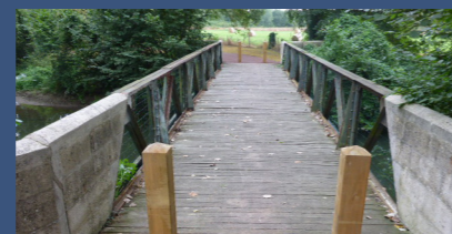
Commune de Braine, éligible au Programme national Ponts