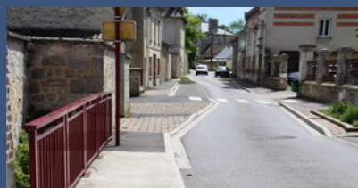
Commune de Braine, éligible au Programme national Ponts