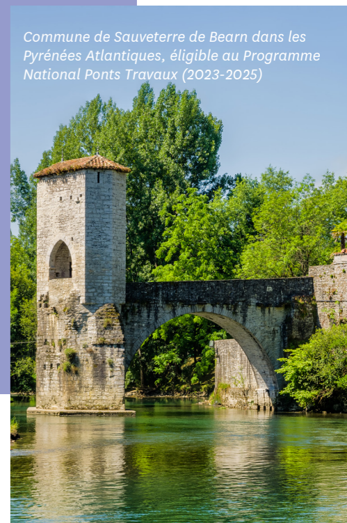
Commune de Sauveterre de Bearn dans les Pyrénées Atlantiques, éligible au Programme National Ponts Travaux (2023-2025)

Pour vérifier votre éligibilité, il vous suffit de vous rendre sur le site du Cerema : www.cerema.fr/programmenationalpontstravaux