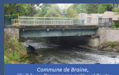
Commune de Braine, éligible au Programme national Ponts