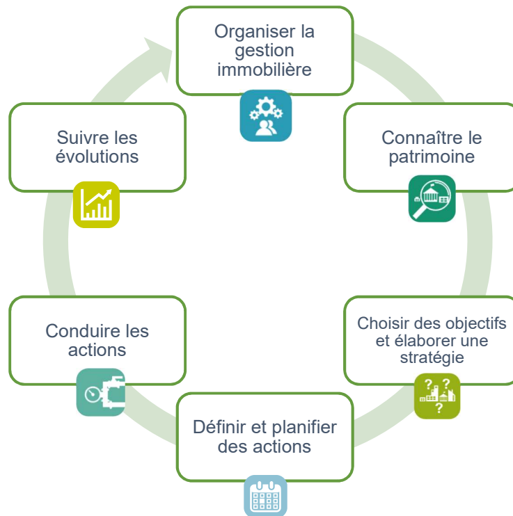
Processus d'une gestion de patrimoine immobilier active en 6 étapes (Cerema, 2016)

L'objectif principal du document est de permettre aux techniciens des collectivités, en charge de l'élaboration et/ou la mise en œuvre d'une stratégie immobilière d'apporter un éclairage sur la première phase du processus de gestion de patrimoine immobilier décrit ci-dessous en aidant à identifier les repères organisationnels et les tâches/missions qui permettront par la suite l'élaboration d'une stratégie immobilière.