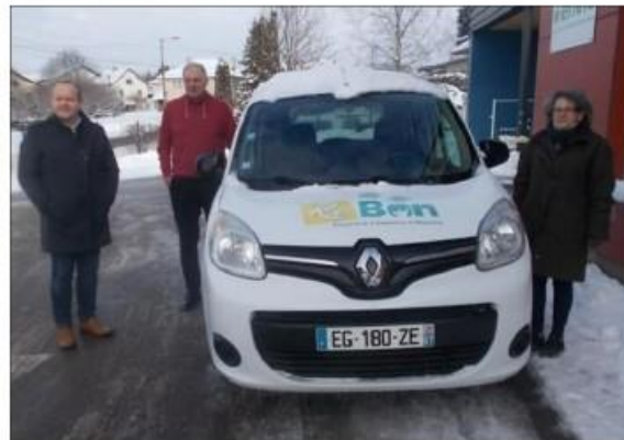
Le Président de la com-com, le Président de ReBon et l'un des chauffeurs du véhicule.

Deux permis ont été payés et deux véhicules sont à disposition. C'est le Syndicat intercommunal d'action sociale qui a également travaillé au projet depuis 9 mois. Actuellement, le service est opérationnel avec grille tarifaire et kilométrique. Bien évidemment, ce service a un coût