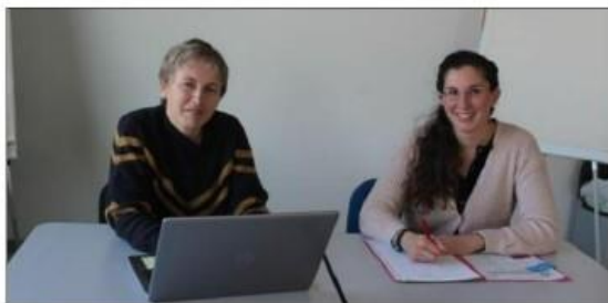
La responsable du CIAS et la directrice de la recyclerie travaillent de concert pour l'objectif mobilité.

publication gratuite, ainsi que dans une version numérique et les sites internet et Facebook de la CCPM, que les habitants du territoire sont sollicités à répondre à une dizaine de questions afin de connaître précisément leurs besoins. Ce nouveau service a plusieurs objectifs : favoriser la mobilité tout en créant du lien social, permettre aux habitants de la CCPM de se rendre à divers rendez-vous administratifs et médicaux, mais également aller en courses, chez les commerçants du territoire, passer du temps avec sa famille et ses amis, participer à des activités culturelles. Les habitants auront juste à déposer les questionnaires complétés dans leur mairie ou pourront l'envoyer au CIAS, 24 Rue Montalembert 25 120 Maïche.