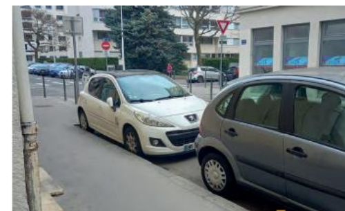
Stationnement motorisé la majeure partie de l'année