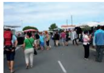
En période estivale