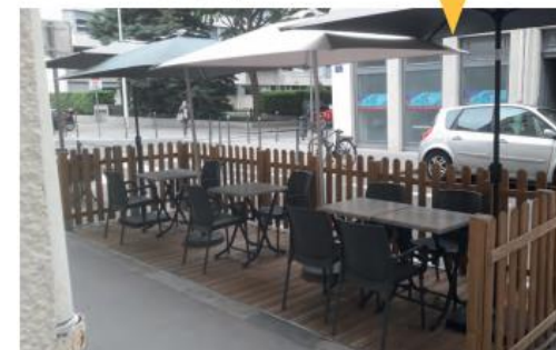
Aménagement de terrasses quelques mois de l'année

Conférence technique territoriale Normandie Centre