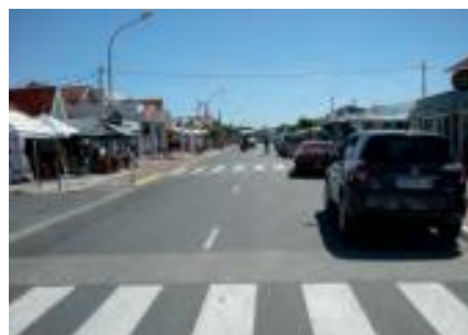
Hors période estivale