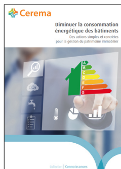
Diminuer la consommation énergétique des bâtiments