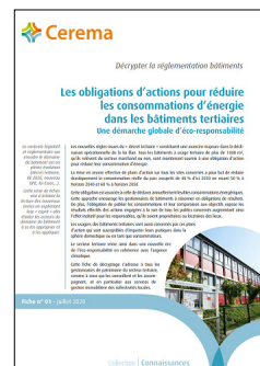
Décrypter la réglementation bâtiments Obligations d'actions pour réduire la consommation d'énergie dans les bâtiments tertiaires