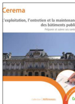
L'exploitation, l'entretien et la maintenance des bâtiments publics Préparer et suivre ses contrats