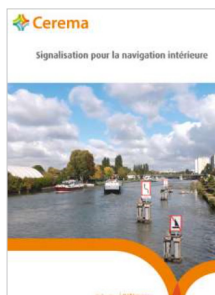
Signalisation pour la navigation intérieure