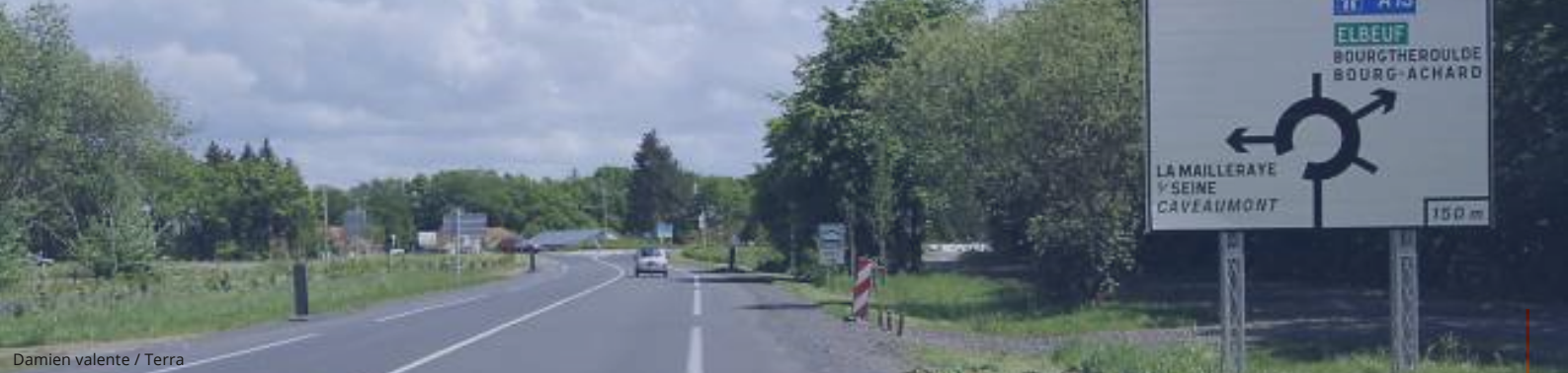
Damien valente / Terra

La signalisation routière est régie par de nombreux textes dont le Code de la Route, l'arrêté de 1967 modifié et l'Instruction Interministérielle sur la Signalisation Routière (IISR-arrêté du 22 octobre 1963).