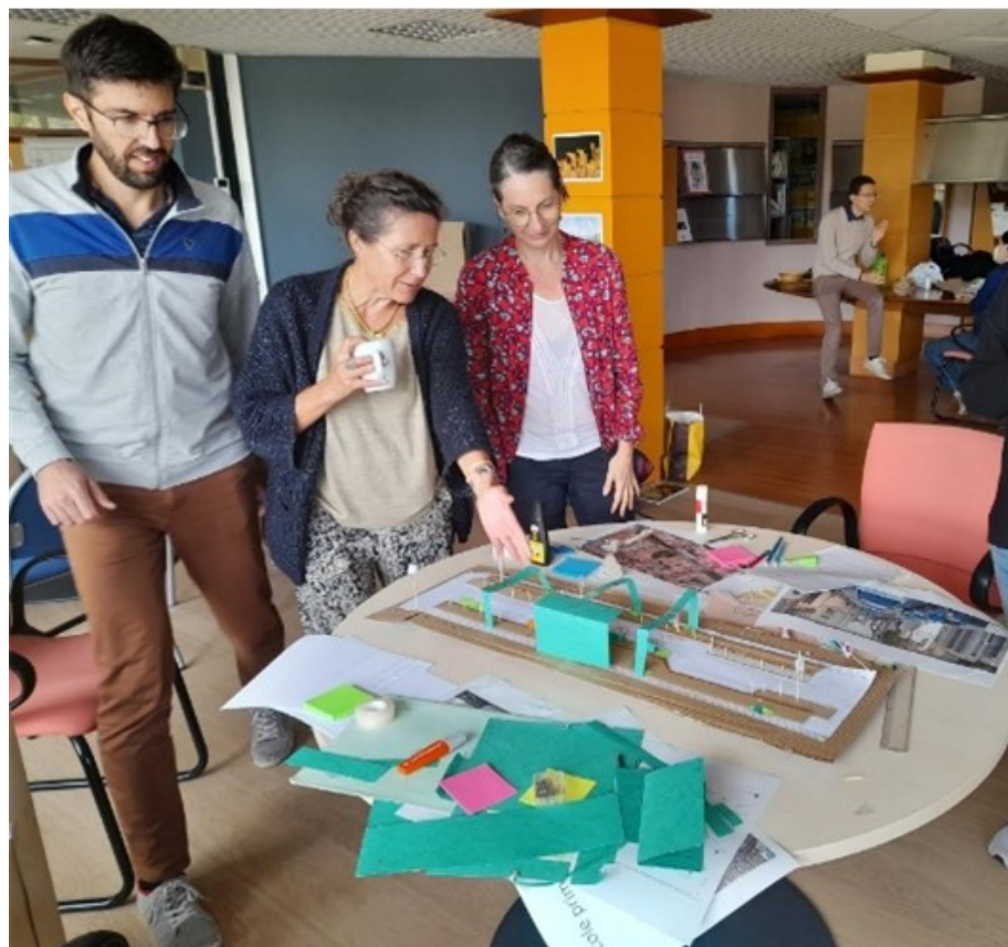
Figure : atelier interne de créativité en vue de l'élaboration d'un scénario de pacification des abords d'une école de Marseille

Pour tester cette aide méthodologique au projet (volet 1), le Cerema et la ville de Marseille mobilisent différents acteurs de la fabrique de la ville dans le cadre d'ateliers collaboratifs, afin d'élaborer pour quelques cas réels d'écoles des scénarios-types d'aménagement (formalisation de pré-programmes illustrés) qui articulent les différents leviers de pacification (avec schémas de principe d'aménagement). Ces écoles ont été sélectionnées en raison des contrastes marqués entre les configurations territoriales dans lesquelles elles s'inscrivent (tissu ancien dense de centre-ville, tissu de quartier prioritaire de la politique de rénovation urbaine, tissu de faubourg...).