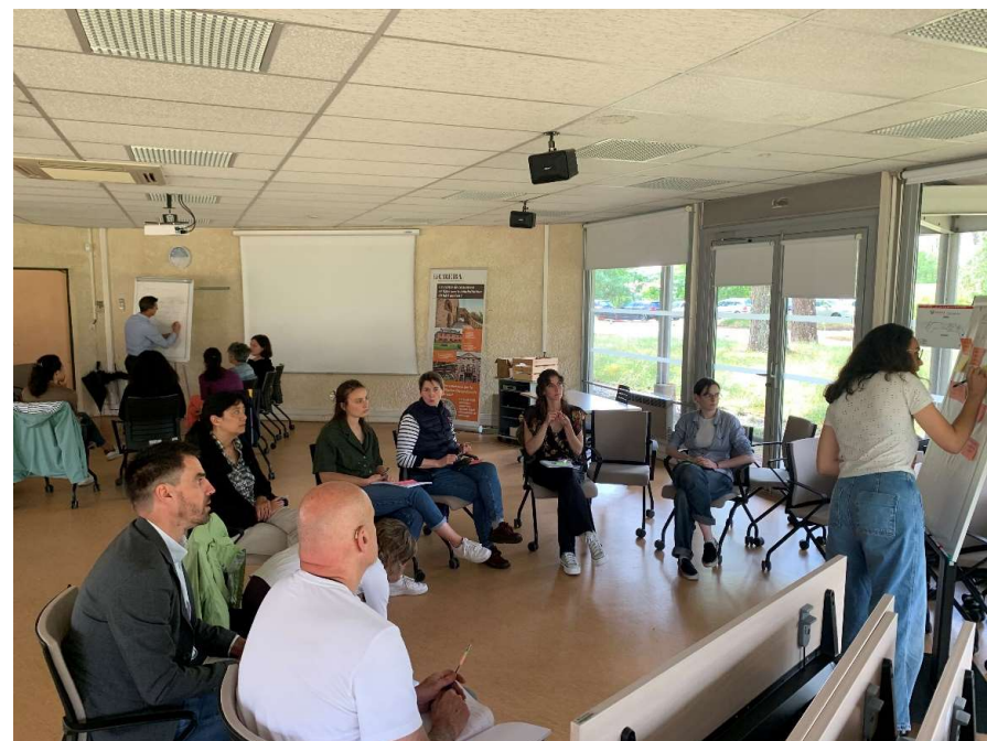
Atelier Transition juste, au Cerema, animé par ADEME

Science 22 aout, étude IA sur 1500 politiques de décarbonation dans 41 pays de 1998 à 2022), 70 % des mesures utiles l'ont été lorsqu'elles étaient combinées à une ou plusieurs autres initiatives. Conditionne l'acceptabilité des décisions publiques.