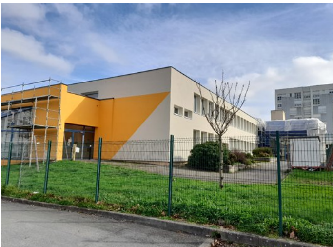
2023-24 – Isolation Thermique par l'Extérieur de l'école Jules Verne

Nombre d'habitants : 49 617 (INSEE 2020)