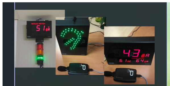
Figure 1 : afficheur pédagogique communicant dans une école pilote

La métropole a également proposé une formation spécifique dédiée au bruit dans les cantines, venant ainsi enrichir son programme d'éducation à l'environnement sonore qu'elle déploie depuis de très nombreuses années.