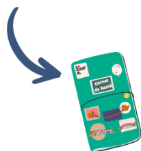
UN CARNET DE SANTÉ

Une carte d'identité et un carnet d'entretien tout en un