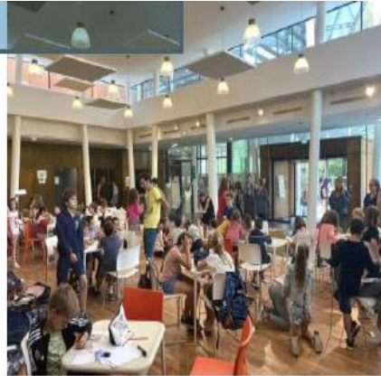
Accueil des enfants au pôle culturel du Taillan

Page facebook Feu Landiras Sud Ouest, 38 000 membres