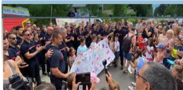
Feu Landiras et Sud-Ouest