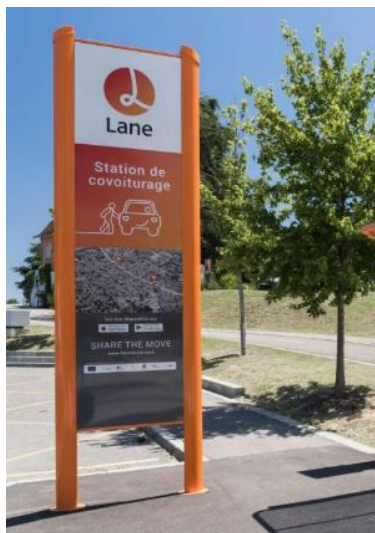
Appel à partenaire national Cerema « Évaluation des services de covoiturage » - 2024