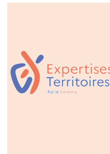
Rejoignez la communauté nationale « Covoiturage » sur Expertises-Territoires