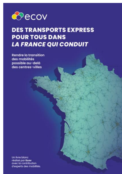
ECOV. Des transports express pour tous dans la France qui conduit. Livre Blanc - 2024