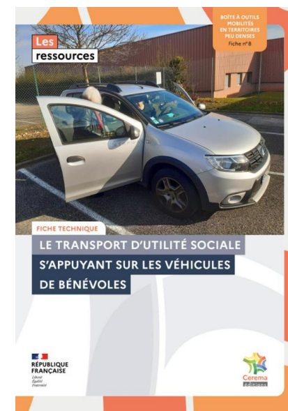
Cerema. Le transport d'utilité sociale s'appuyant sur les véhicules de bénévoles. Boite à outils de l'intermodalité en territoires peu denses - 2023