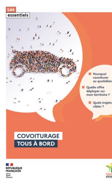
Cerema. Covoiturage. Tous à bord. Les essentiels - 2023