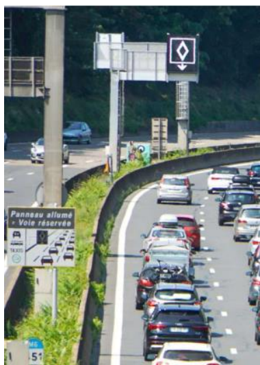
Cerema. Développement du covoiturage au quotidien. Série de fiches sur des démarches locales – 2021 à 2023