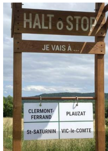
Appel à partenaires national Cerema « Massifier la pratique du covoiturage » - En cours