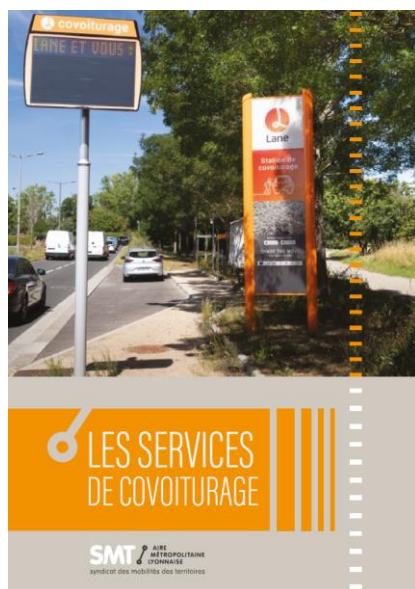
SMT AML. Les services de covoiturage - 2024