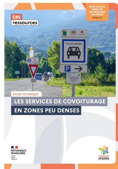
Cerema. Les services de covoiturage en zones peu denses. Boite à outils de l'intermodalité en territoires peu denses - 2023