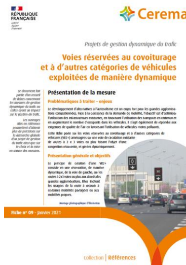
Cerema. Voies réservées au covoiturage et à d'autres catégories de véhicules exploitées de manière dynamique : Projets de gestion dynamique du trafic - 2021