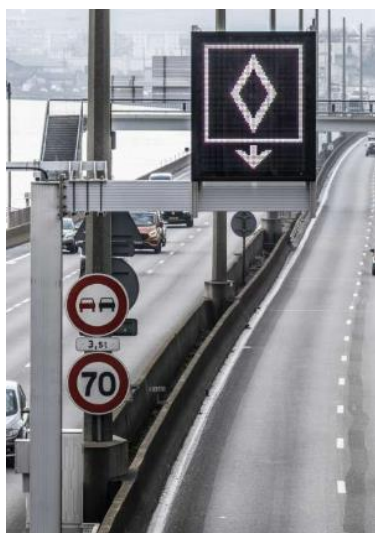
Retour sur la journée nationale des gestionnaires de voies réservées au covoiturage - 2024