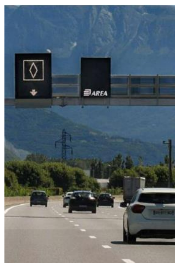
Les voies réservées au covoiturage en France : un état des lieux du Cerema - 2021