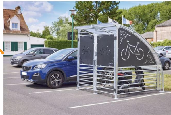
Exemple d'abri vélos sécurisé