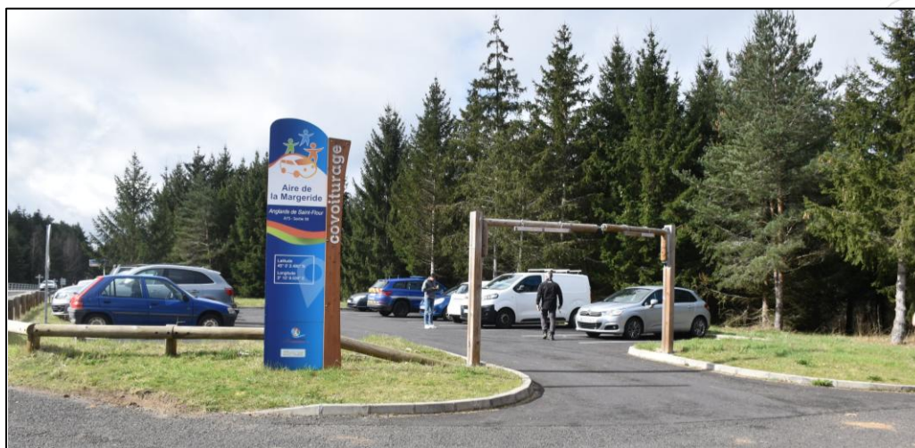
Aire de covoiturage de la Margeride