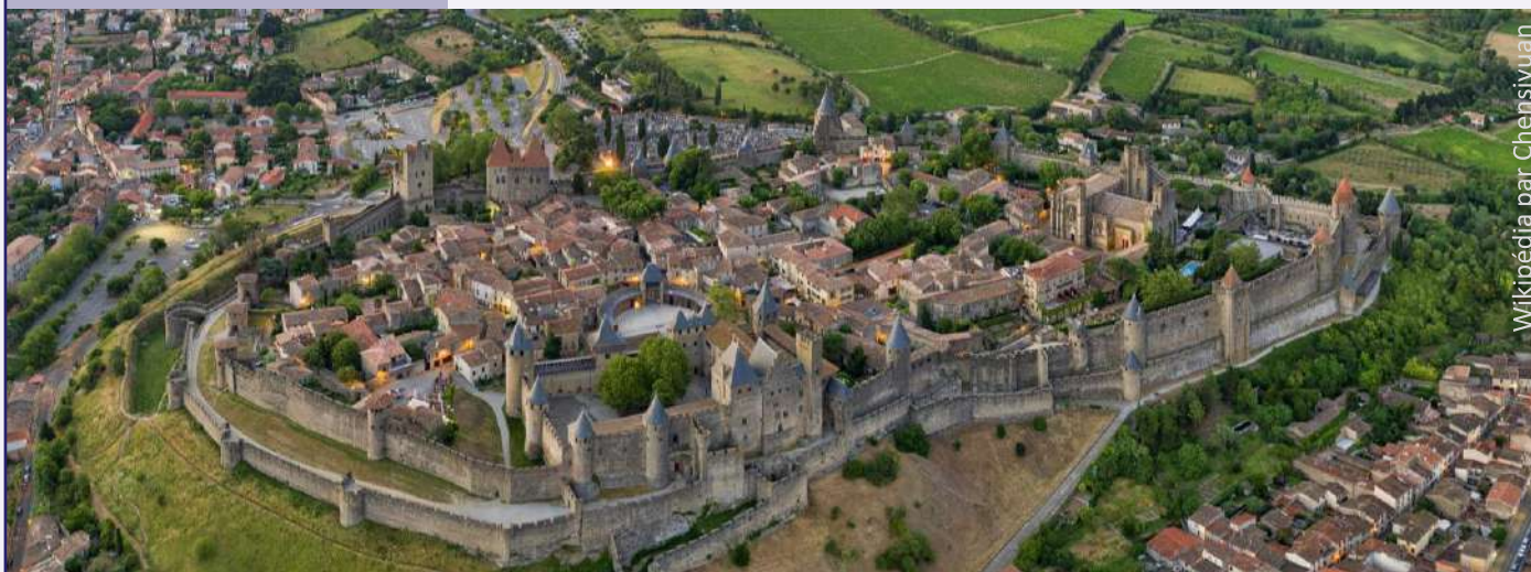
Wikipédia par Chersyuan

Cette journée technique est destinée aux collectivités et permettra d'échanger sur les outils de la stratégie foncière (UrbanSIMUL, UrbanVitaliz, Cartofriches, France Foncier+ etc) et de découvrir des retours d'expériences en termes de sobriété foncière, renouvellement urbain, renaturation ou encore créations d'observatoires.