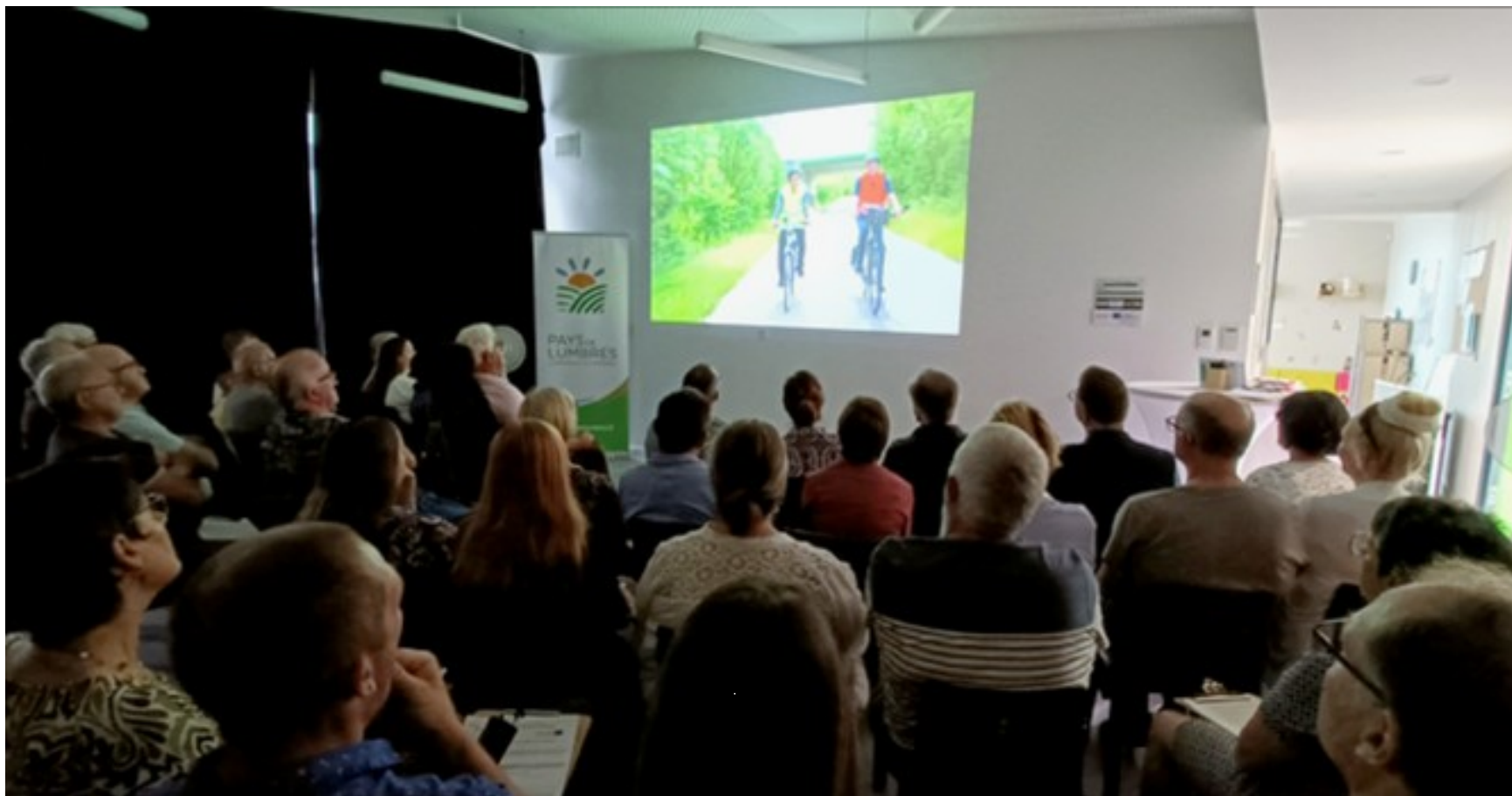
Avant-première projection publique du film Mobilités Rurales – Un voyage au Pays de Lumbres (Lumbres, le 16 juin 2025).