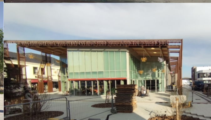
La place place du Champ de foire avant et après la construction des halles