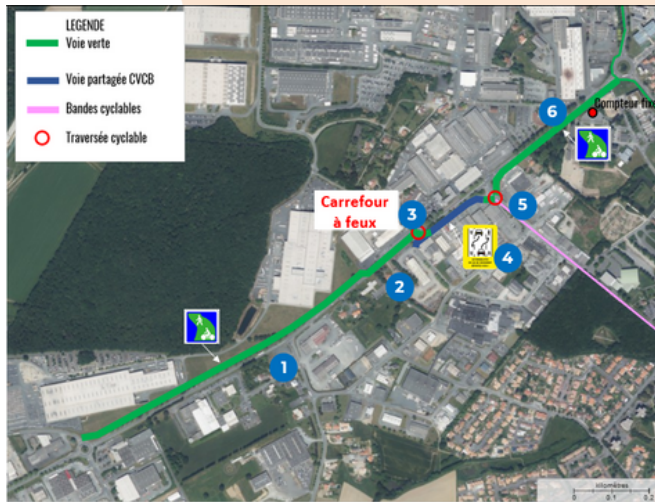
Identification des prises de vues sur l'avenue des Sables