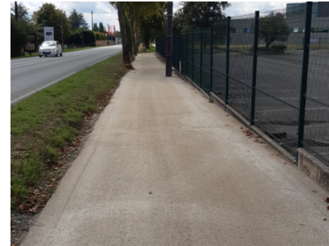
2 - Voie verte avec séparation physique de la chaussée le long du moulin des affaires