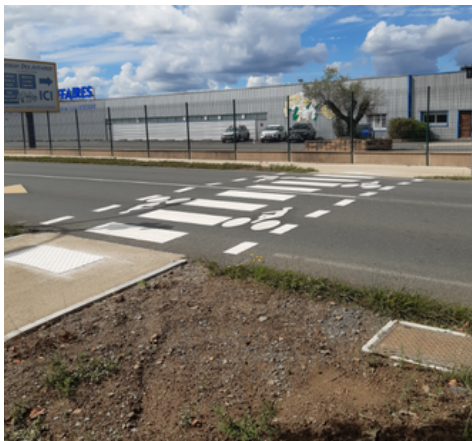
3 - Traversée sur RD160-Avenue des Sables avec feux tricolores