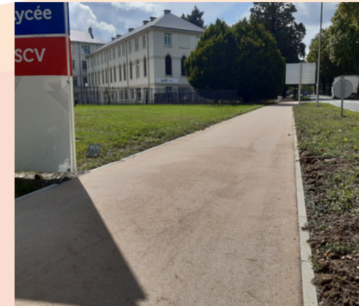
6 - Voie verte en enrobé beige le long du lycée Jean 23