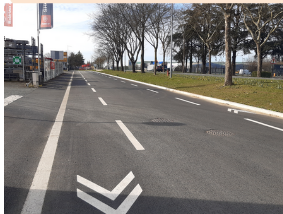
4 - Chaussée à voie centrale banalisée sur rue Olivier De Serres le long de l'Avenue des Sables pour assurer la continuité entre 2 sections