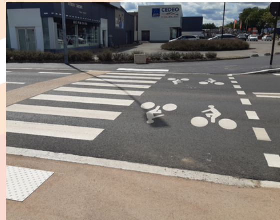
5 - Traversée sur rue Ampère avec une traversée à niveau pour piétons et cyclistes