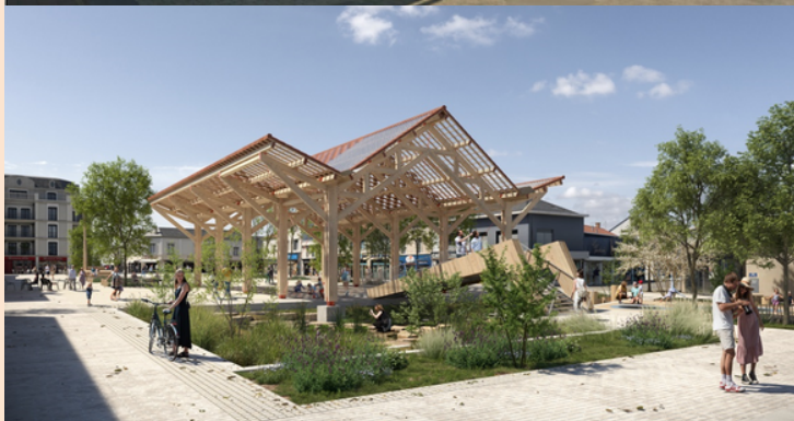
La place A. Briand et ses halles avant travaux et le projet de retraitement de la place