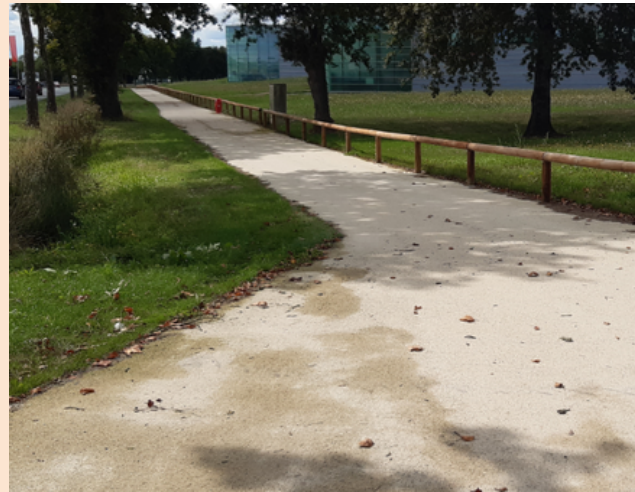
1 - Voie verte en sable compacté avec liant chimique sur 3 m de large