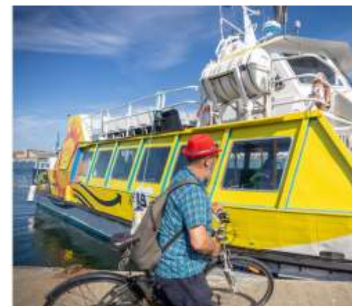
Un service étendu pendant les 10 jours du Festival Interceltique (20h/24)