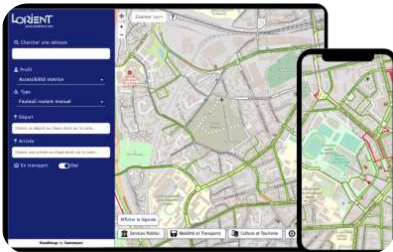
Calculateur d'itinéraire bus/navire/vélos/PMR