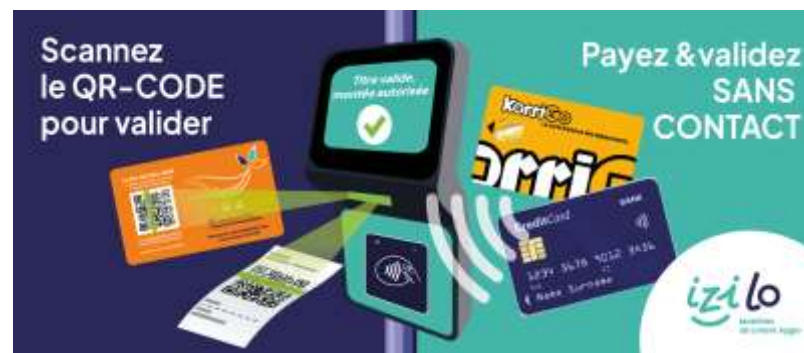
Titres de transports et gamme tarifaire uniques navires/bus