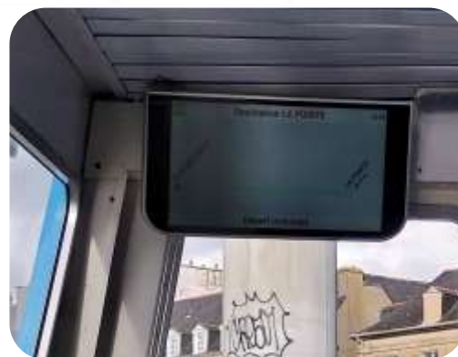
Information voyageur dans les navires et sur les quais