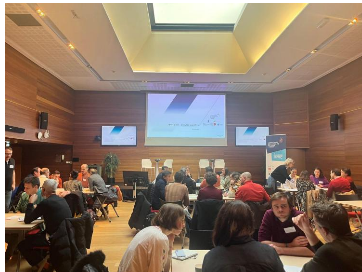
9 décembre 2025 Atelier n°2 à Lille 40 participants sur ½ journée