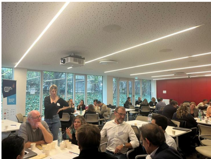
6 novembre 2025 Atelier n°1 à Issy Les Moulineaux 40 participants sur 1 journée

Les deux ateliers collaboratifs ont permis de réunir divers acteurs de la mobilité solidaire, ce qui a permis des échanges riches et la consolidation des orientations du dispositif.