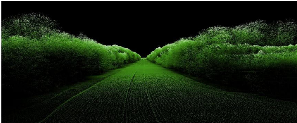
LiDAR HD, Forêt de Rambouillet

Au-delà de leur objectif propre, les cas d'usages joueront un rôle structurant : chacun contribuera à orienter les choix pour le socle technique, à affiner les modèles métiers et à développer des services capables de dialoguer entre eux.