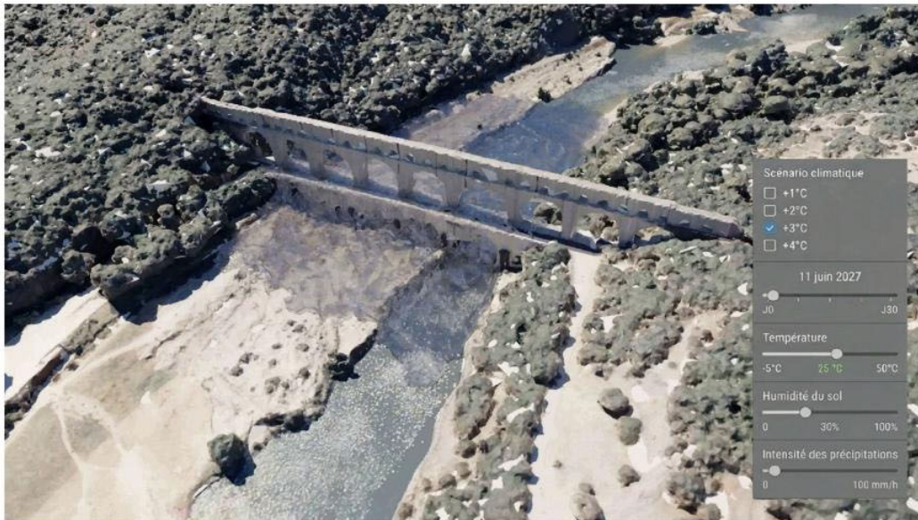
Illustration conceptuelle d'un jumeau numérique de territoires, Pont du Gard – montage réalisé avec l'aide d'un outil d'IA générative)

Les champs d'application thématiques et territoriaux sont nombreux : enjeux d' aménagement , de transport , de transition écologique des territoires , d' adaptation au changement climatique et de santé publique , entre autres.