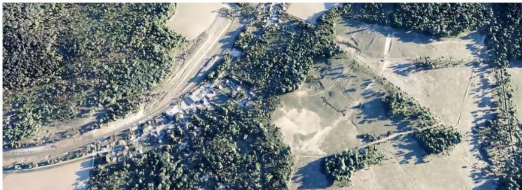
Modélisation 3D de la forêt domaniale du Chêne à la Vierge (Marne)

Autre objectif majeur, JUNN constituera enfin une Place de Sciences, un « bac à sable » ouvert pour tester et mettre au point des solutions dans des conditions répliquables, en favorisant la collaboration avec les acteurs académiques et en accélérant la montée en maturité de nouvelles solutions.