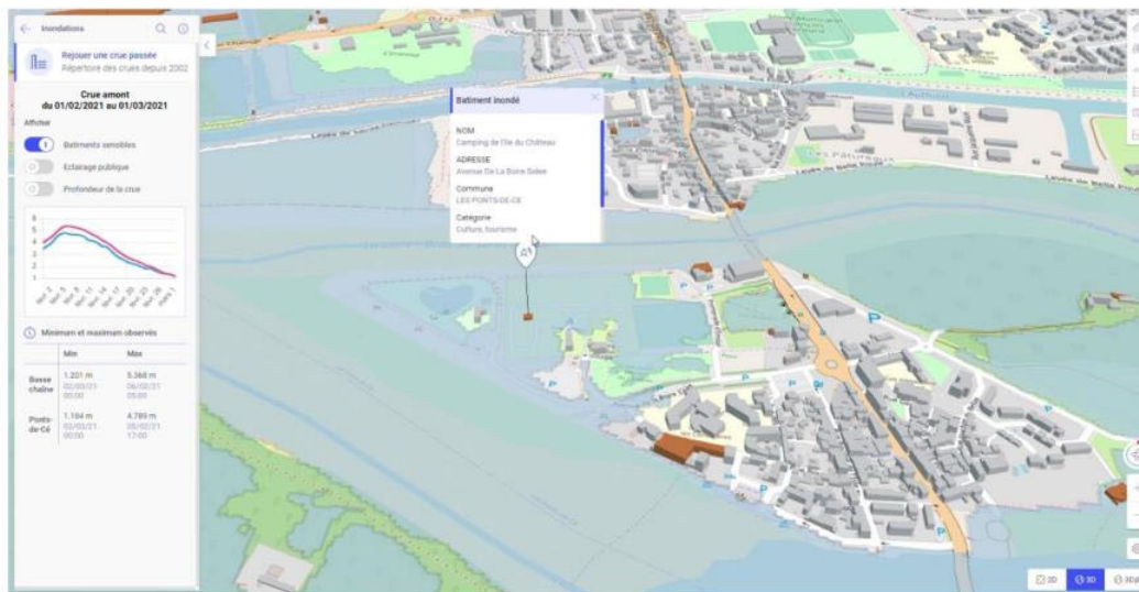
Simulation de crue à Angers

Un jumeau numérique de territoires peut par exemple simuler les conséquences d'une crue centennale sur un territoire, en tenant compte de l'évolution du climat. Il peut également simuler des scénarios d'aménagement et leurs conséquences sur le trafic routier.