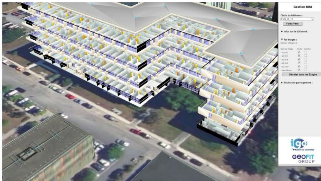
Exemple d'intégration d'un bâtiment modélisé en 3D (BIM) dans une maquette de territoire.

Ces travaux ouvriront la voie à la deuxième phase du programme, dite d' exploitation opérationnelle , qui débutera en 2029.