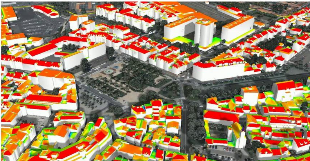
Cadastre solaire, Les Sables-d'Olonne

Pour un fournisseur de solutions technologiques, JUNN constituera une occasion unique de changer d'échelle. En s'appuyant sur son socle national unifié, une entreprise pourra concentrer ses efforts sur des briques métier à forte valeur ajoutée plutôt que de reconstruire des couches techniques de base. JUNN facilitera aussi la rencontre avec les collectivités, les opérateurs et les acteurs publics, tout en offrant des opportunités de financement via des appels à projets. Il ouvrira ainsi l'accès à un marché national structuré et accélèrera l'industrialisation des solutions pour renforcer la souveraineté technologique française.