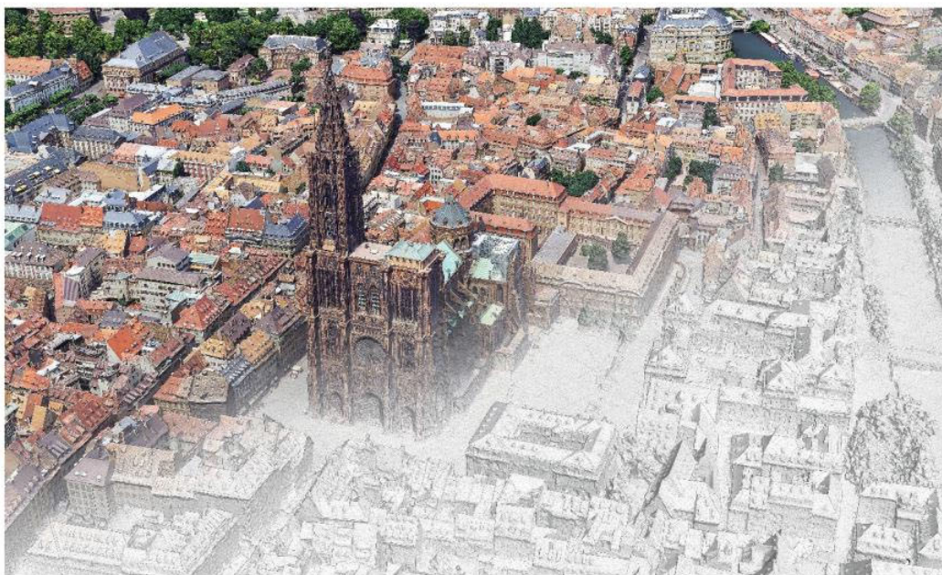
Modélisation 3D, Strasbourg

Opération soutenue par l'État dans le cadre du dispositif « Jumeau numérique de la France et des territoires » de France 2030, opéré par la Banque des territoires (Caisse des dépôts)