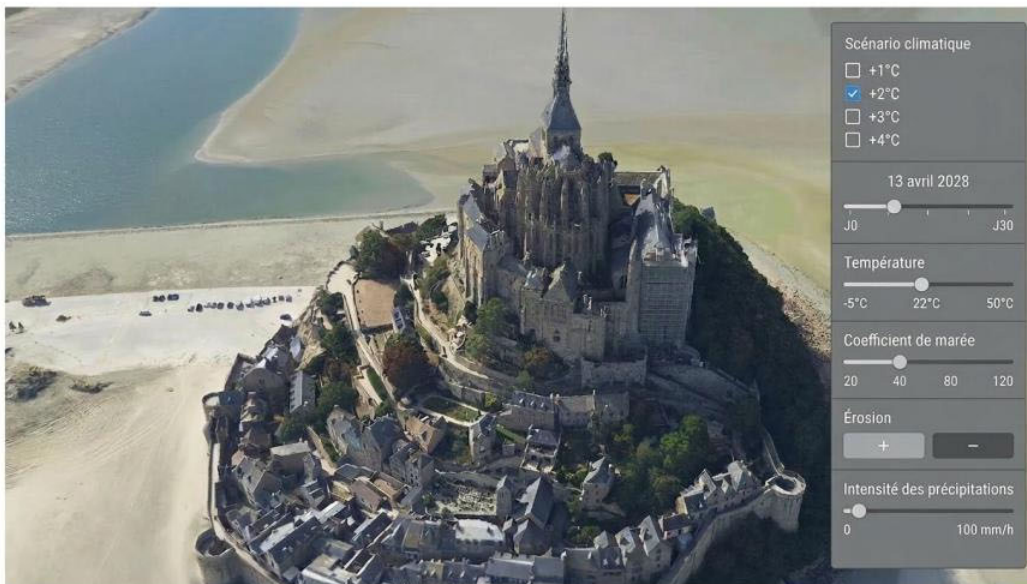
Illustration conceptuelle d'un jumeau numérique de territoires, Mont-Saint-Michel (© GEOFIT/IGO/IGN – montage réalisé avec l'aide d'un outil d'IA générative)

Concrètement, il s'agit de mettre à disposition une base technique mutualisée et ouverte, composée de briques logicielles de gestion et de visualisation des données de description du territoire, d'interfaces (API) et de services d'interaction avec de l'IA. Cette base technique servira à capitaliser et mutualiser les efforts de production et de développement, à réduire les coûts d'entrée pour les acteurs locaux, et à permettre de réutiliser facilement des solutions d'un territoire à l'autre . Elle sera accompagnée d'un ensemble de données homogènes sur l'ensemble du territoire qui seront directement exploitables. Les acteurs locaux et nationaux, privés comme publics, pourront ainsi travailler à partir d'informations fiables, facilement comparables , sans avoir à retraiter des données et à reparamétrer les outils pour chaque nouveau besoin.