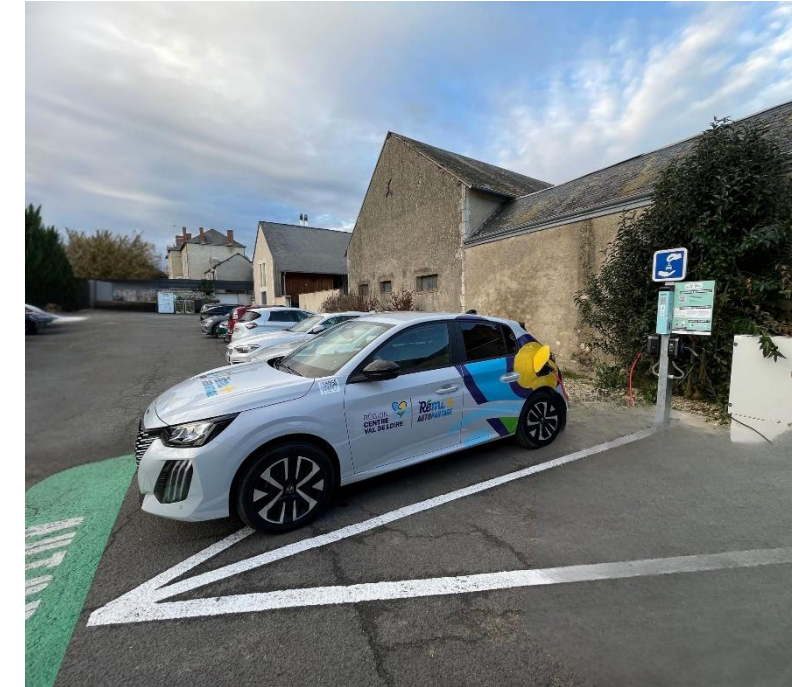
Service Remi + autopartage en région Centre-val-de-Loire