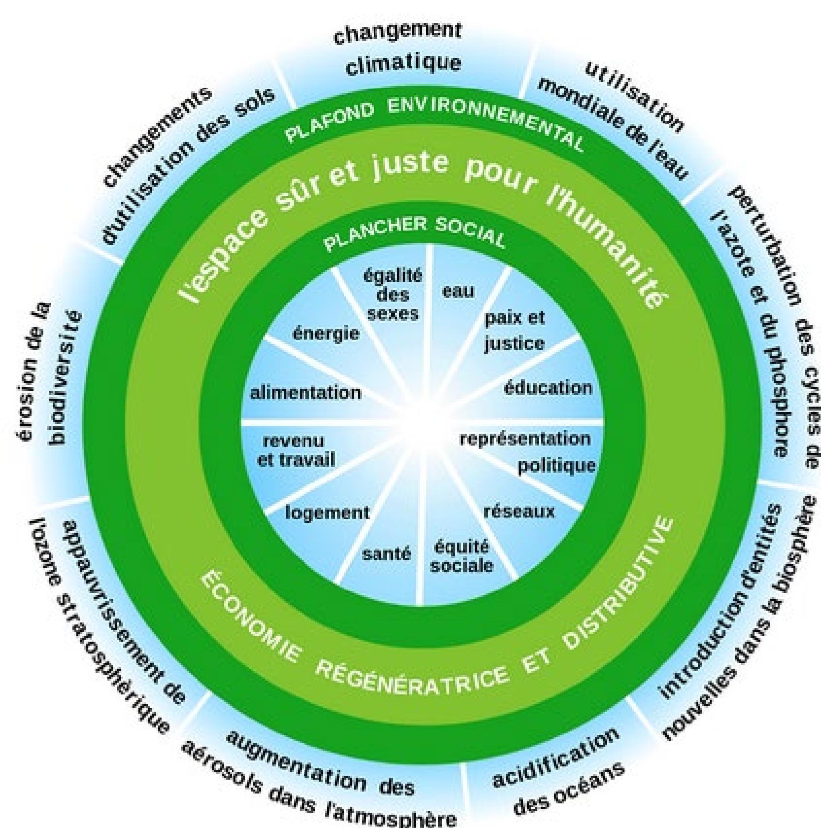
Théorie du Donut de Kate Raworth

Pour aider les collectivités départementales à répondre à ces questions, le Cerema propose une offre de service destinée au Départements adhérents de AURA et BFC pour les accompagner à bâtir une stratégie de transitions, d'adaptation et de résilience.