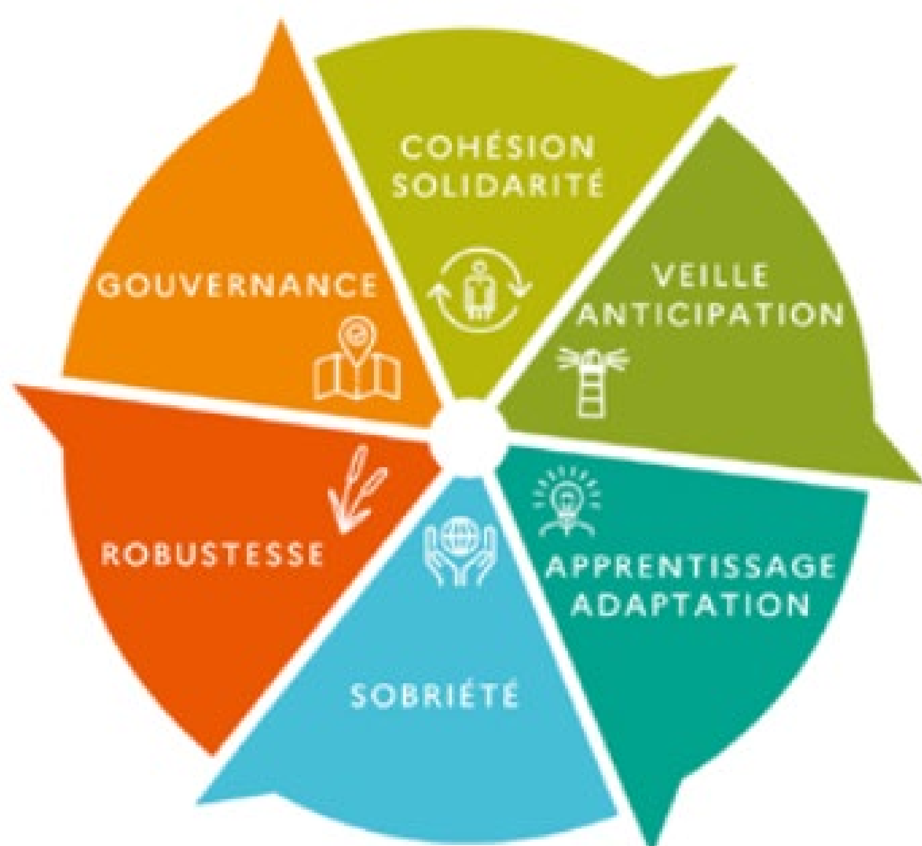
Boussole de la résilience - Cerema