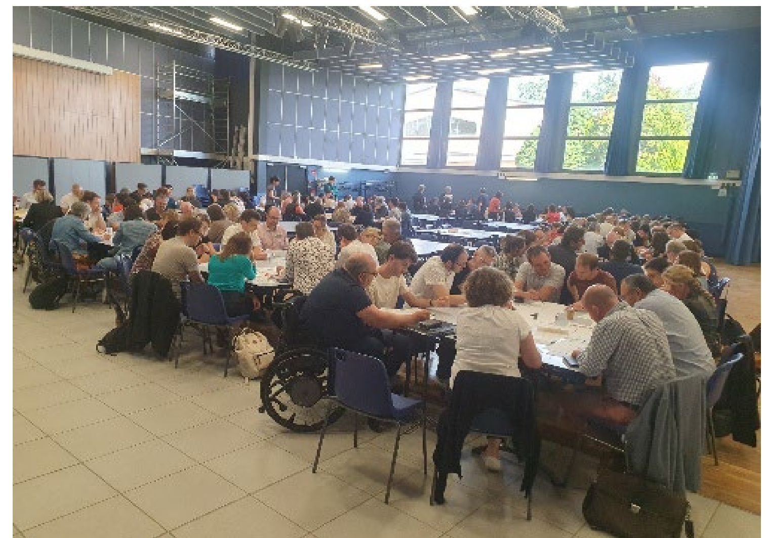
Ateliers de co-construction avec les cadres du Département de l'Ain

Son objectif était de mettre en adéquation dans un cadre cohérent l'ensemble de ses champs d'intervention et modalités de travail avec les enjeux de la transition écologique, et répondre ainsi à un des chantiers du projet d'administration de la collectivité.