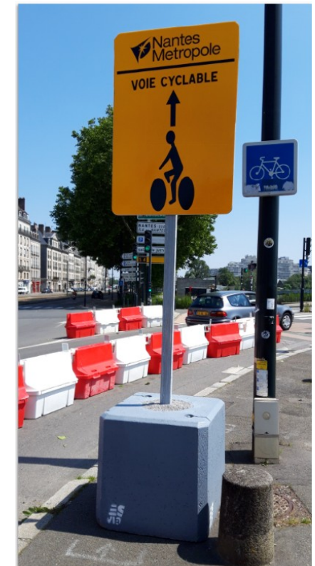
Pont Anne de Bretagne à Nantes