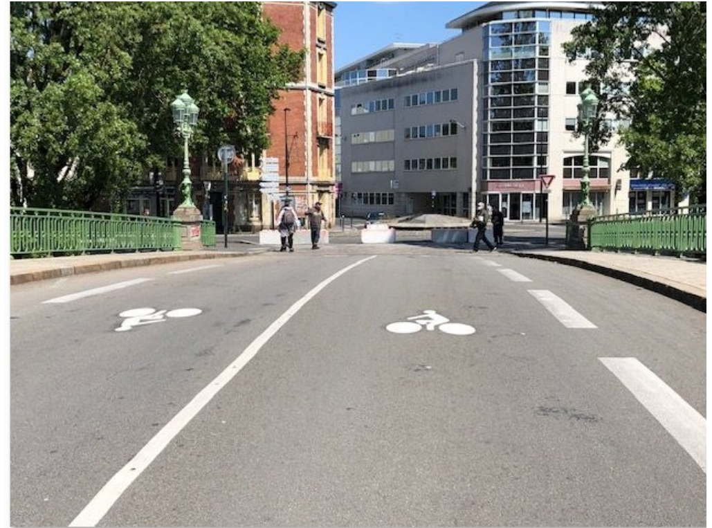
Pont Saint-Mihiel à Nantes