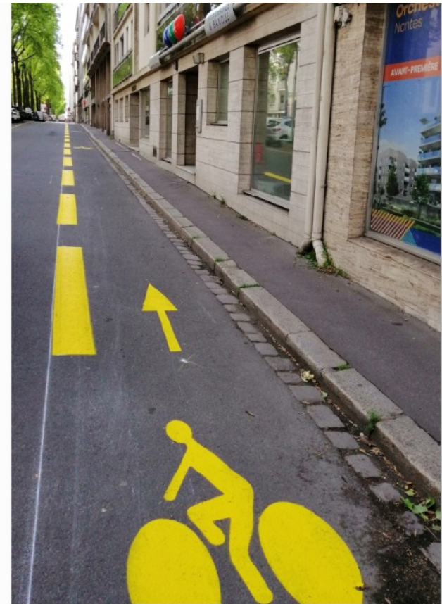
Boulevard Gabriel Guist'hau à Nantes