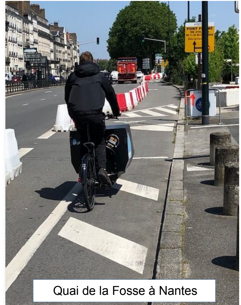
Quai de la Fosse à Nantes