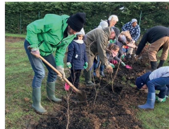
Chantier participatif de plantation du verger (principe de parrainage)