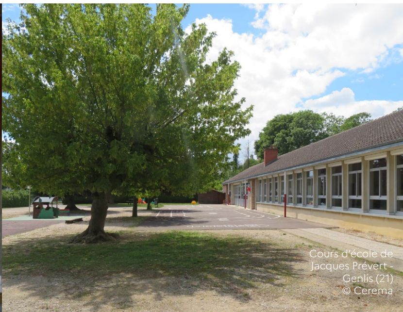
Cours d'école de Jacques Prévert - Genlis (21)