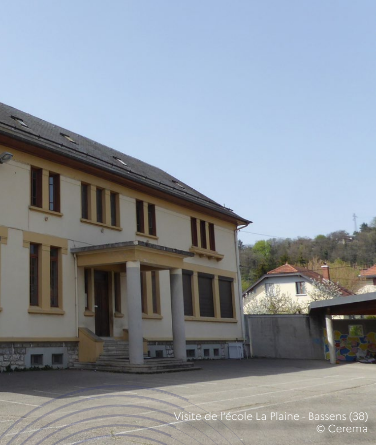
Visite de l'école La Plaine - Bassens (38)