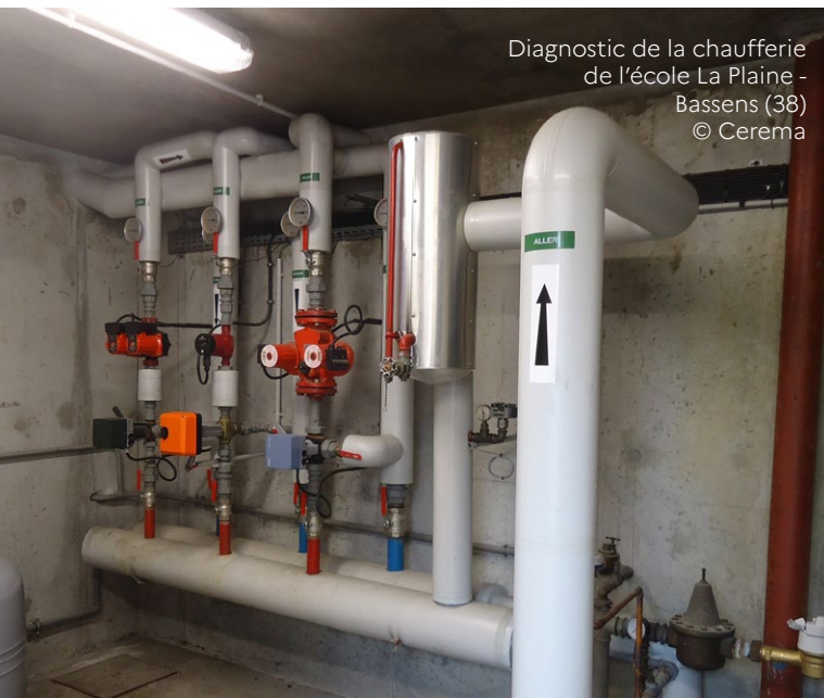
Diagnostic de la chaufferie de l'école La Plaine - Bassens (38)