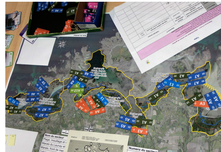
Plateau du jeu de rôle « Rivages de demain » réalisé sur Penvénan

Cette étude fait l'objet d'une gouvernance élargie ; y sont associées différentes parties prenantes. La réflexion sur le devenir du littoral est réalisée à l'échelle de la commune et la phase opérationnelle est mise en œuvre par une diversité d'acteurs publics, pour certains intervenant au-delà du périmètre communal (Lanion-Trégor Communauté, Département des Côtes-d'Armor, État, Conservatoire du Littoral...), et prend en compte les interventions des acteurs privés tels que les riverains.