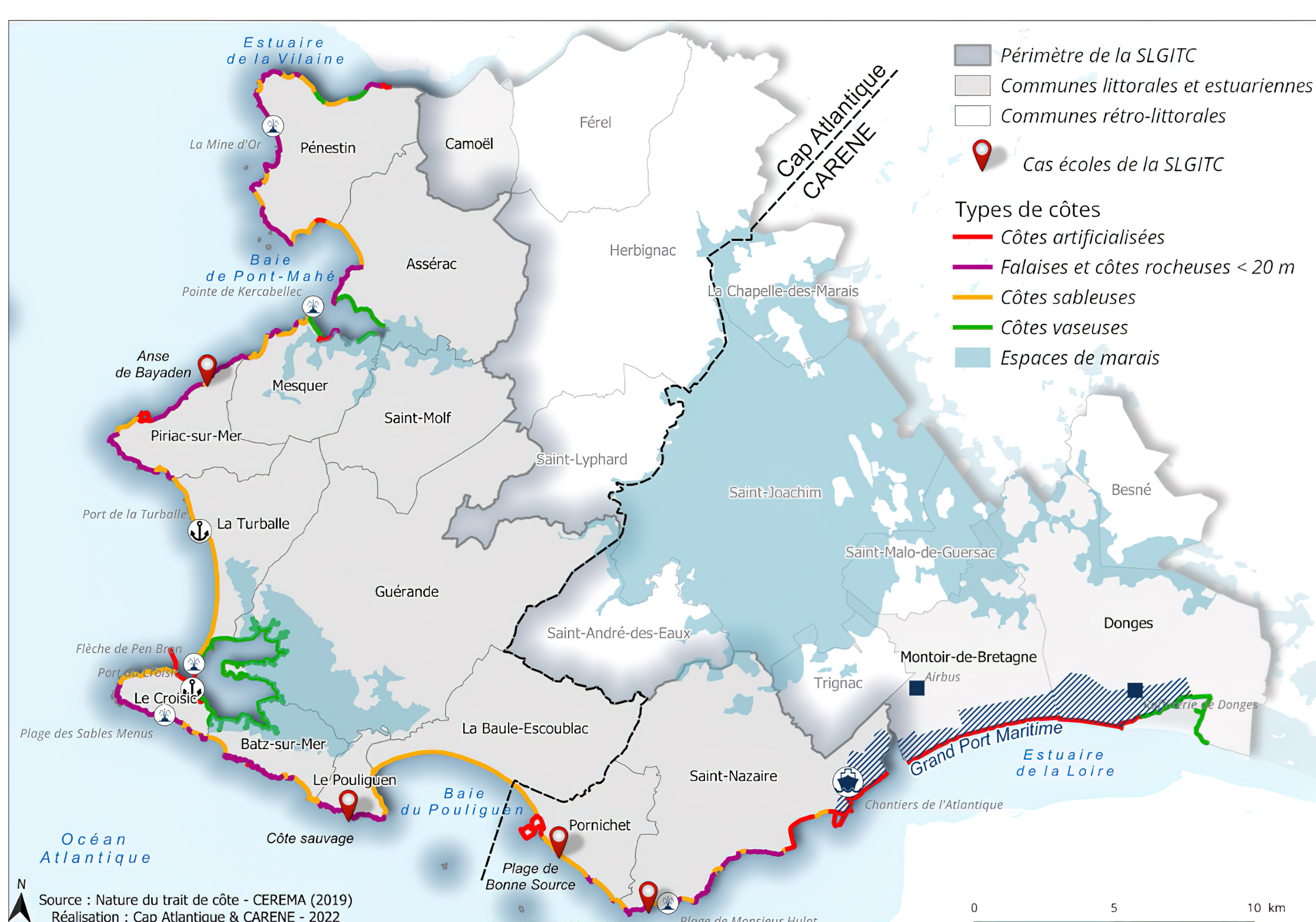
Cartographie des quatre sites-écoles sur les territoires de de Cap Atlantique – La Baule – Guérande agglo et de Saint-Nazaire agglo

Le diagnostic a donné à voir l'ampleur des enjeux futurs du territoire. Des débats initiés dans les dispositifs de gouvernance et de participation , sont ressorties des propositions pour l'avenir du territoire. Ce processus exigeant a abouti à la définition d' orientations stratégiques et d'un plan d'actions (ex : une approche globale de la mobilité est intégrée suite aux différentes contributions).