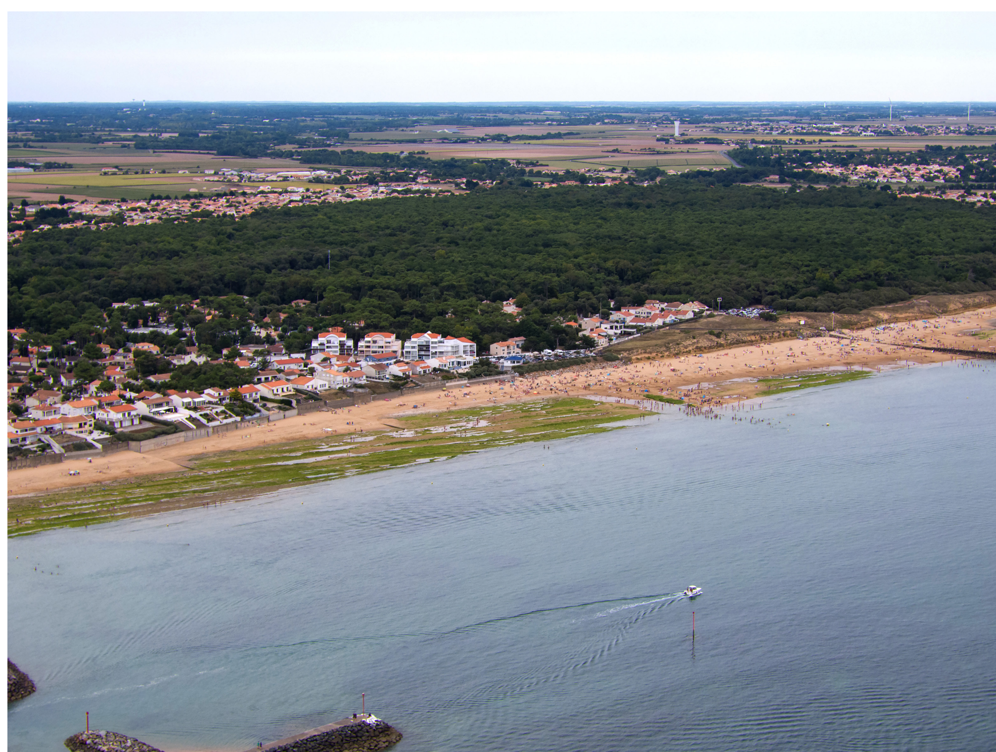
Vue aérienne de la frange littorale de Saint-Vincent-sur-Jard

Pour arriver à un plan d'actions pour le littoral, des projections du trait de côte à différentes échéances ont été nécessaires. Un atlas de vulnérabilité à 30 ans et 100 ans permet de prendre la mesure des actions à mener à court et long terme. Les acteurs locaux ont ensuite réfléchi à un plan d' actions diversifiées et combinées pour leur littoral.