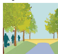
Noue, prairie urbaine