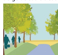
Noue, prairie urbaine