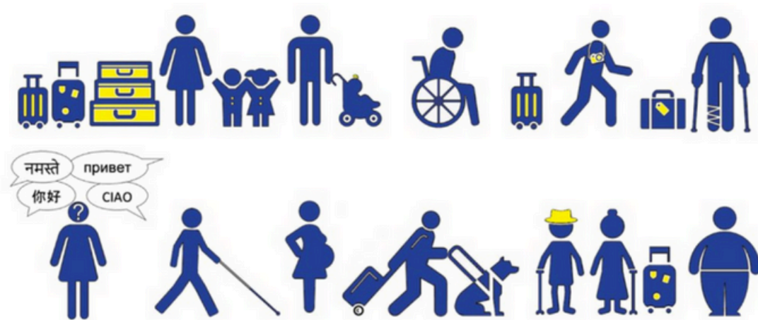
Pictogramme Destination Pour Tous

Le handicap est une notion souvent mal comprise qui recouvre une diversité de situations. Aussi, la tentation d'établir une typologie des différentes déficiences sera forcément réductrice, mais elle permet toutefois de donner un premier éclairage sur la diversité des manifestations du handicap.