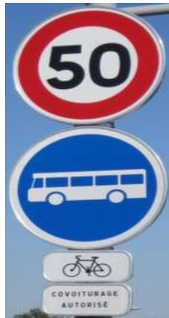
Panneau de prescription B27a : Bus Panonceau de catégorie M4d1 : Vélo Panonceau d'indication M9z : covoiturage autorisé