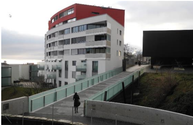
Liaison vélo piéton Neuchâtel