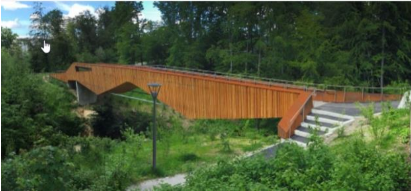
Passerelle Maillefer à Lausanne 200'000 frs