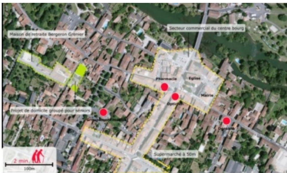
Distance entre les logements, les services et les commerces

alimentation, d'une épicerie ou d'une boulangerie. Les services de soins peuvent être un peu plus éloignés mais la personne vivant dans le logement doit pouvoir être autonome dans sa vie de tous les jours.