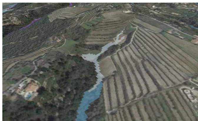
Figure 3: De nombreuses itérations forment une surface

En répétant un grand nombre de fois l'opération, une emprise potentiellement inondable apparaît.