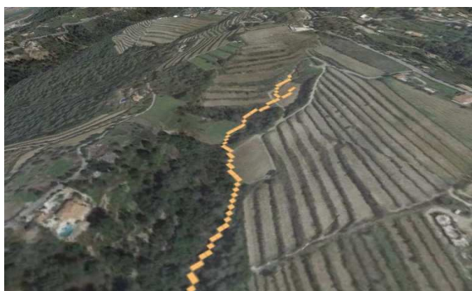
Figure 1: Résultat d'un calcul de thalweg

Un modèle numérique de terrain est nécessaire pour appliquer la méthode. Cette représentation de la topographie permet de calculer les thalwegs (chemins préférentiels de l'eau lorsqu'il pleut).