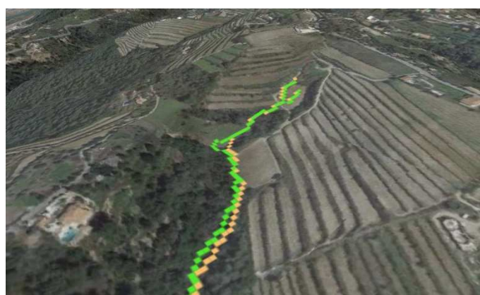
Figure 2: Le calcul de thalweg est un peu différent car le MNT a été modifié

En modifiant légèrement la topographie de manière aléatoire (en la « bruitant »), un nouveau thalweg peut être calculé.