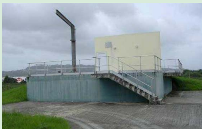
Poste de refoulement Petit Manoir