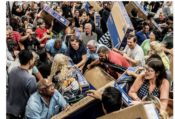
Métros bondés, soldes en magasins, etc.